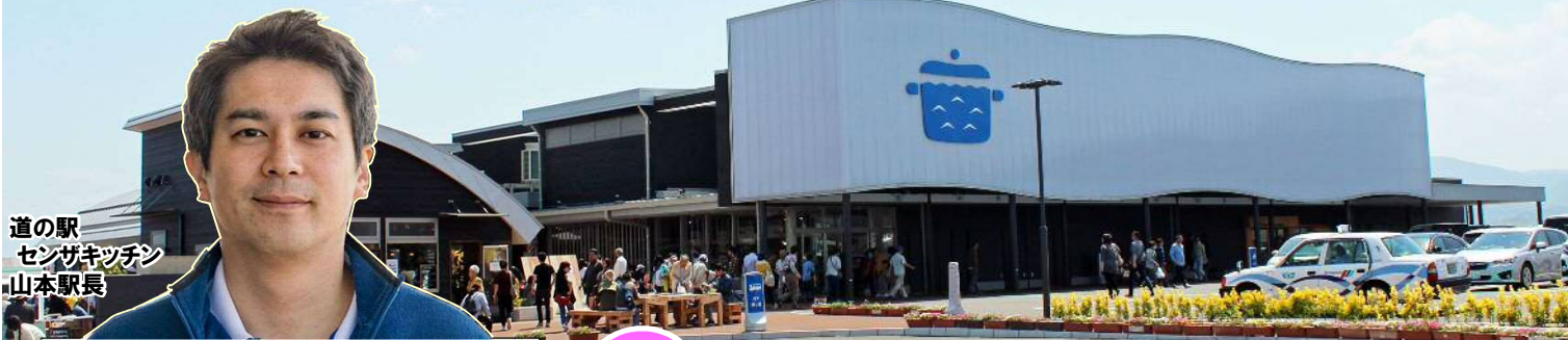
道の駅 センザキッチン 山本駅長