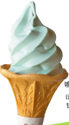
鳴き砂の塩ソフト ほのかな塩味が 甘みをひきたてる一品。