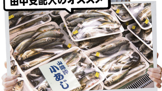
新鮮な朝採りの魚たち。 日によっては何と100円の小あじが並ぶ時も！今の季節ならではの魚は剣先イカ、トビウオ、イサキ。

全国的な駅発祥の地、道の駅「阿武町」。駅の前には日本海のパノラマが広がり、景色を楽しむ方やRVパークとして過ごす方など、穏やかな時間が流れています。 そんな豊かな土地で一番の人気の誇るのが、鮮度の高い魚介類。阿武町や萩、長門の漁港を中心に、様々な漁法で採られた魚が並びます。鮮度の高さ、リーズナブルな価格——そのコスパの高さは開店前に多くの人が列をなす程の人気です。 特産品のキウイは「1年中楽しんで欲しい」との思いからジャムやジュレ、リキュール、焼き菓子などたくさん加工品が並びます。中でも1番人気は、緑が美しいキウイジャム。色を出すのが難しいとき、法を地元の方々が引き継いだものです。 豊富な「食」を味わった後は海に沈む夕日を温泉から眺め、やすらぎのひと時を過ごしてみたいかがでしょうか。