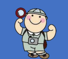
山口河川国道事務所 キャラクターまもるくん