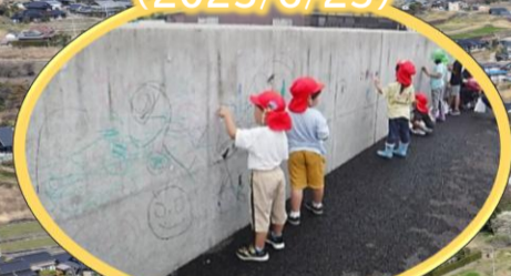
とのみ保育園の皆さん