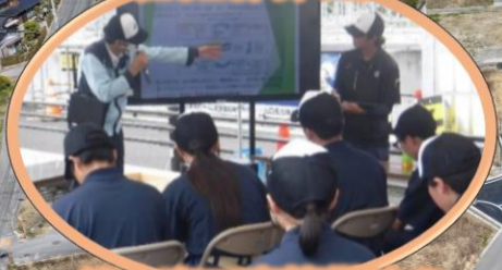
徳山商工高等学校の皆さん