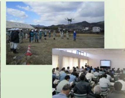
現場見学会・意見交換会