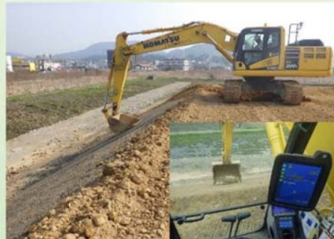
3次元マシンコントロールバックホウ