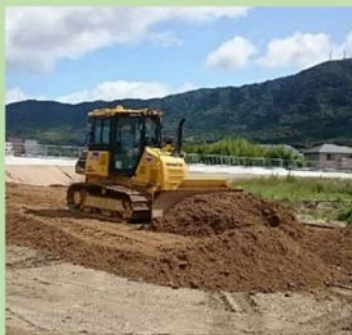
3次元マシンコントロールバックホウ