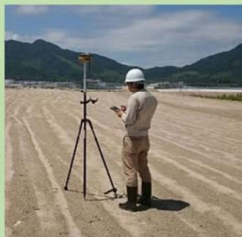
出来形確認（GNSSローバー）