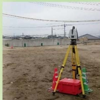
3次元測量（地上レーザースキャナ）