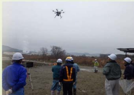
3次元測量（UAV写真測量）