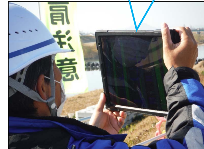
橋脚の鉄筋3Dモデル体感