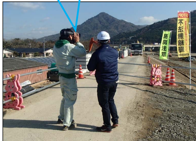
MRゴーグルによるMR体験