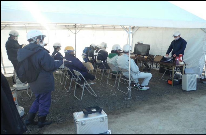
MR技術の概要説明 (参加者9名)