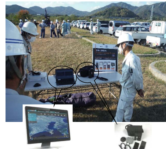
(出来高計測表示例) (GNSSアンテナ) 計測に、手軽さを「スマホで 手軽に土量計測や進捗管理」