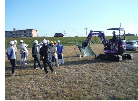
ICT建設機械 (小型BHマシンガイダンス)