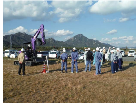
ICT建設機械 (ブレードマシンコントロール)