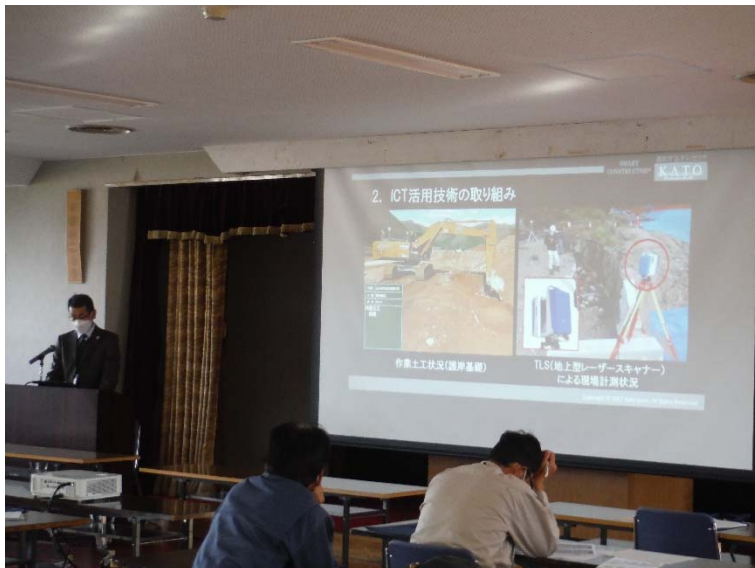
中国ICTサポート トップランナー企業 (株)加藤組 「ICT活用工事導入のメリットについて」講演