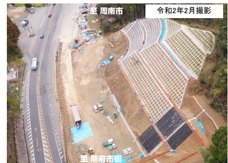
写真① 現在の改良工事進捗状況 (防府市街方面から周南市方面を望む)