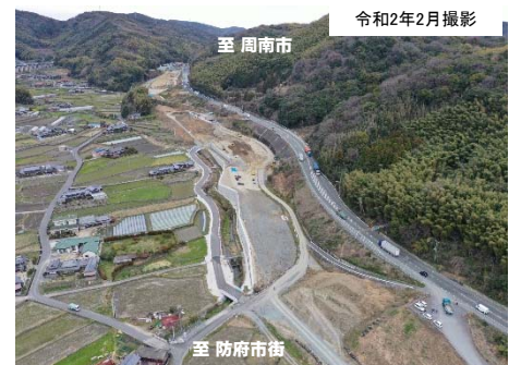
写真② 現在の改良工事進捗状況 (防府市街方面から周南市方面を望む)