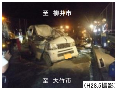
▲写真 交通事故発生状況