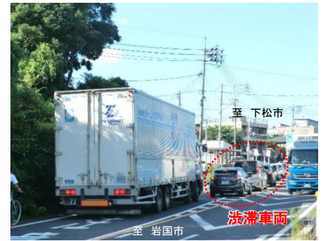
【写真①】交通混雑の状況