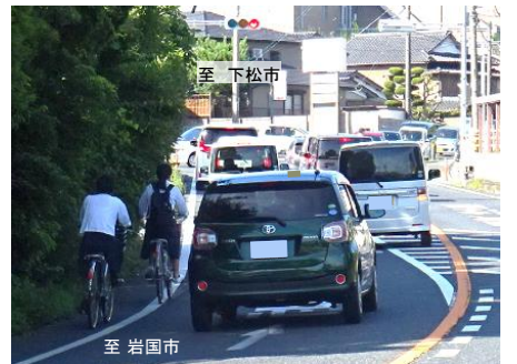
【写真②】狭小区間における自転車走行状況