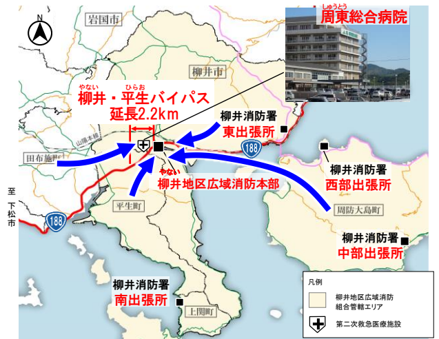
図 柳井・平生地域の救急搬送状況