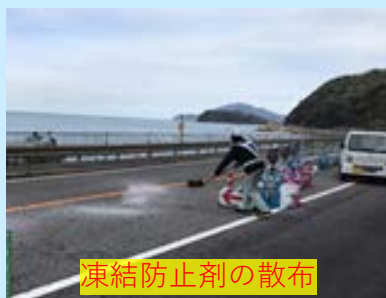
凍結防止剤の散布