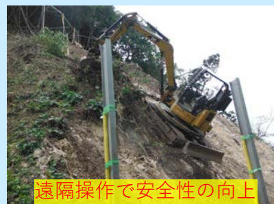
遠隔操作で安全性の向上