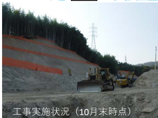
工事実施状況（10月末時点）