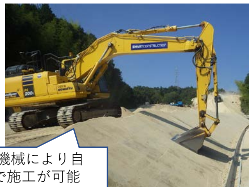
ICT建設機械により自動制御で施工が可能