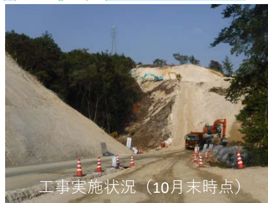
工事実施状況（10月末時点）

この現場では、土木工事の生産性、安全性を向上させるため、3次元データの作成、ICT建設機械による施工など、ICT（情報通信技術）を活用した施工の取り組みを行っています。