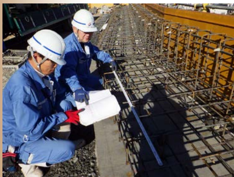
先輩から後輩へ 安全・確実な施工に向け 技術伝承中！！