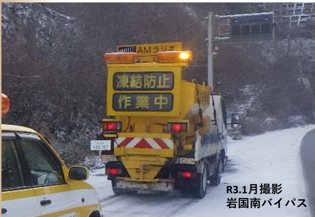
R3.1月撮影 岩国南バイパス

「冬用タイヤの装着やチェーンの携行」など早めの準備のほか、お出かけ前には道路情報や気象情報の確認をお願いします。