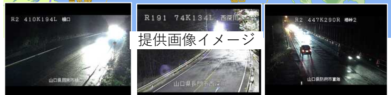
提供画像イメージ

カメラ画像のほか、気温や路面温度、路面状況、積雪深さの情報を10分おきに自動更新しています。 モバイルでの情報取得は右のQRコードで。