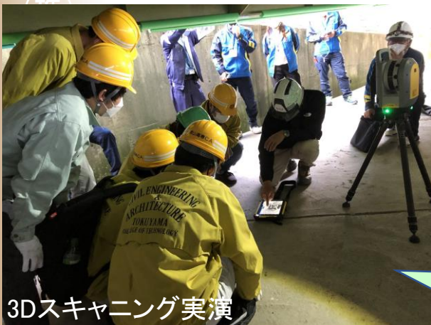
3Dスキャニング実演