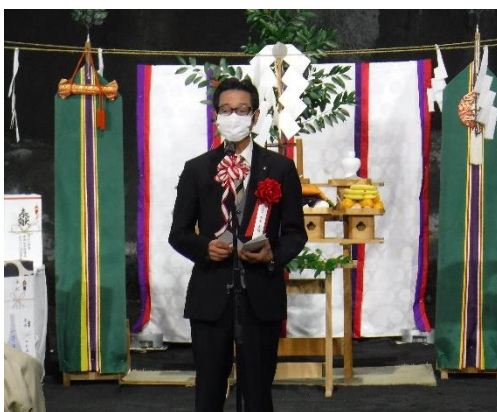
米本和木町長祝辞