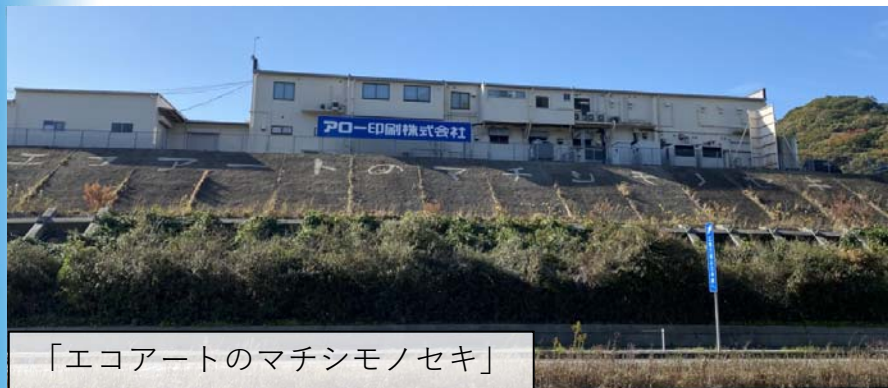
「エコアートのマチシモノセキ」