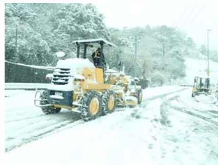
グレーダーによる除雪作業