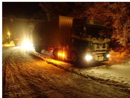
夜間発生したスタック車両