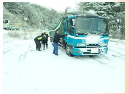
吉見PA内でのスタック移動応援作業