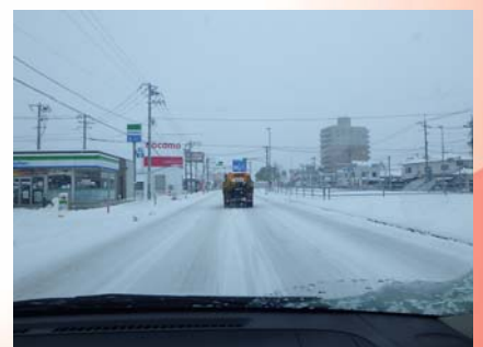
国道190号山陽小野田市新生町付近