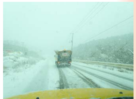
凍結防止剤散布作業