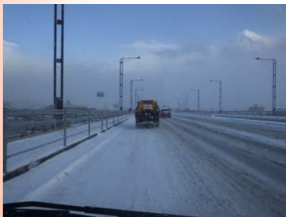
国道190号厚東川大橋付近