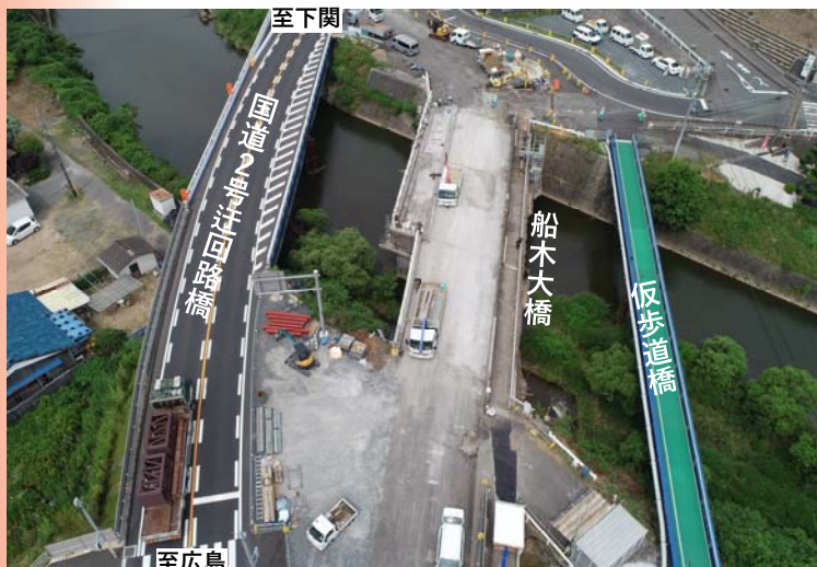
橋桁撤去前 (令和3年6月30日撮影)