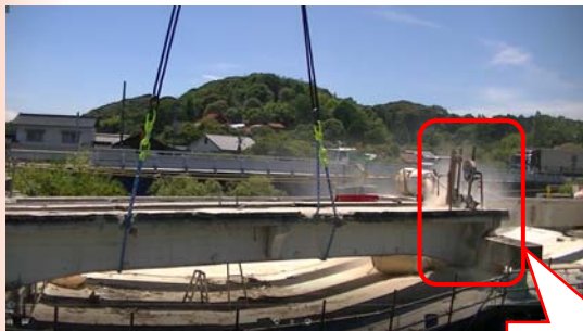
ワイヤーソーによる橋桁切断状況

11月から、河川内にある橋脚の撤去を開始します。地域の皆様には引き続きご迷惑をおかけしますが、ご理解とご協力をお願いします。