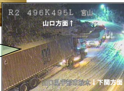
通行止めにより動けなくなった滞留車両