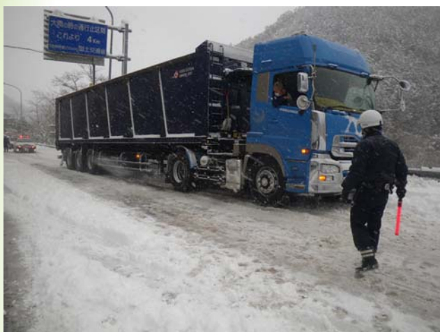
国道9号木戸山峠 立ち往生車両