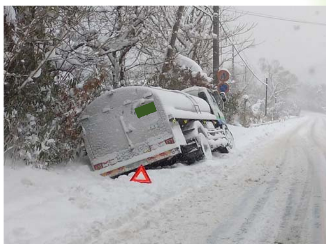
国道9号阿東地福下 雪道での単独事故