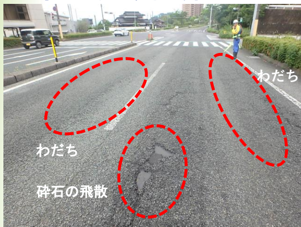
着手前（わだちや碎石の飛散などがありました）