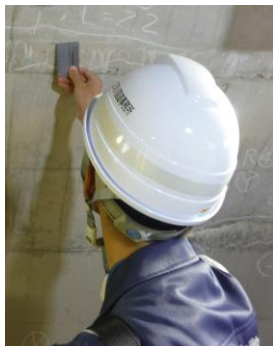
ひび割れ幅の測定