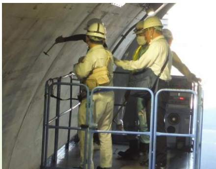
近接目視、ハンマー打診による点検