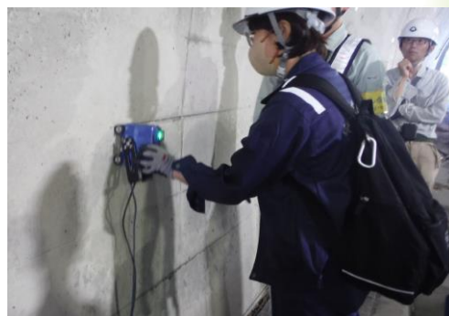
変状部検知システムによる点検