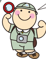
山口河川国道事務所 キャラクター「まもる君」

国土交通省中国地方整備局では、今後30年間程度の具体的な河川整備の内容を示す「佐波川水系河川整備計画(原案)【国管理区間】」を作成しましたので、 ご意見を幅広く募集するために、このチラシをお配りしています。