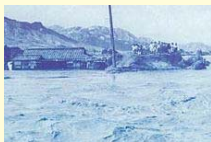
下右田地区付近 右岸7K2付近

新橋地点流量: 2,800m 3 /s 家屋浸水: 3,397戸 家屋損壊: 1,083戸