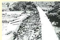
徳地岸見地区付近 右岸20K0付近