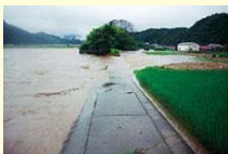
徳地岸見地区付近 右岸19K0付近