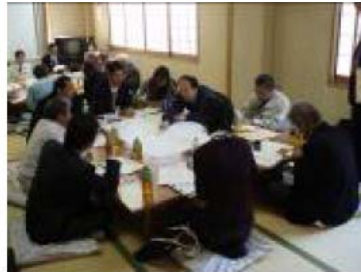
▲ワークショップ(意見交換)の様子