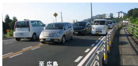
▲右折車が滞留している様子