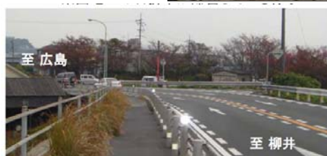
▲交差点柳井側の下り坂の急カーブの様子