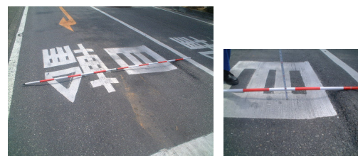
舗装のわだち掘れ