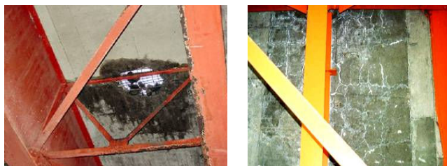
橋の裏面の様子(床版)