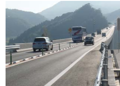
吉広高架橋付近(萩市街方面を望む) ※9月27日撮影