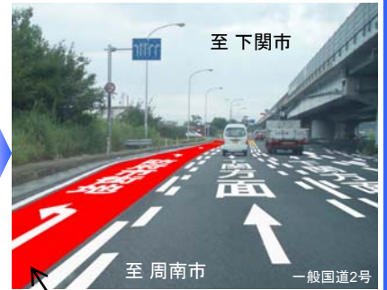
滑り止めカラー舗装【赤色】