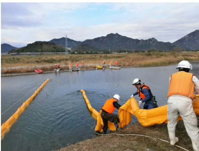
オイルフェンス展張訓練 (昨年の実施状況)

水質汚濁事故の対策については、その原因となる物質によって対応が異なります。そのため、事故を発見した初期の段階で、原因物質をいち早く把握する必要があります。この訓練では、現場において原因物質を素早く判定するための一連の作業を行います。