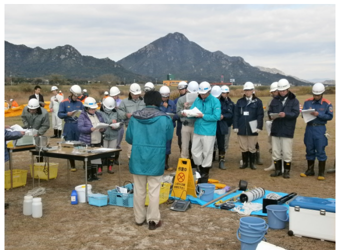
採水及び水質簡易分析訓練 (昨年の実施状況)