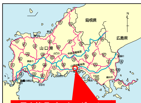
周南簡易パーキングエリア (道の駅「ソレーネ周南」)