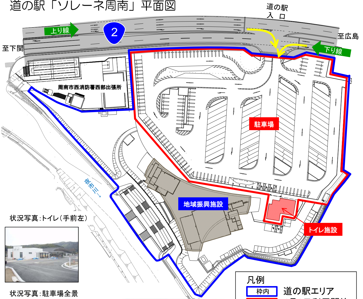
状況写真: トイレ (手前左)