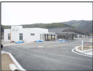
状況写真: 駐車場全景