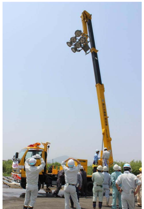
照明車の設営及び操作訓練状況