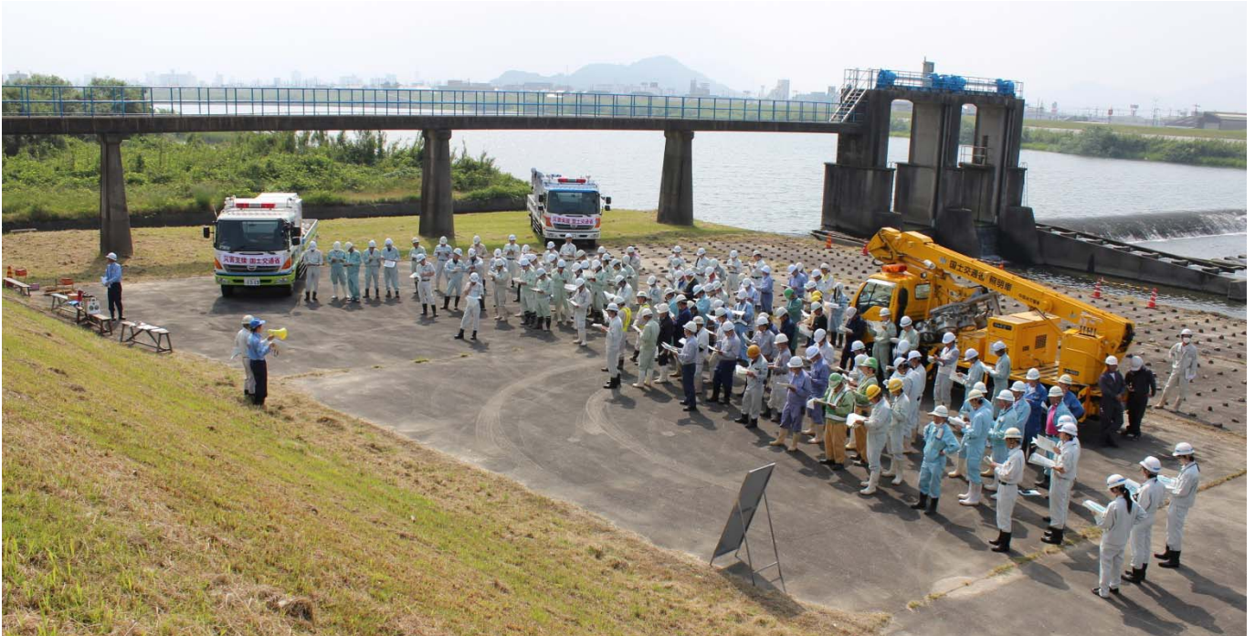
国土交通省職員及び46社86名の災害協定業者が訓練を行いました。