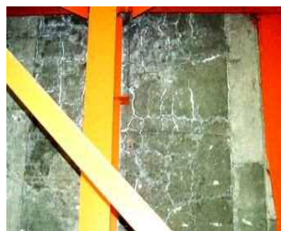
橋の裏面の様子(床版)