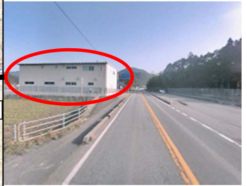
宮野スノーステーション