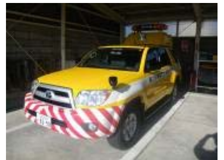
道路パトロールカー