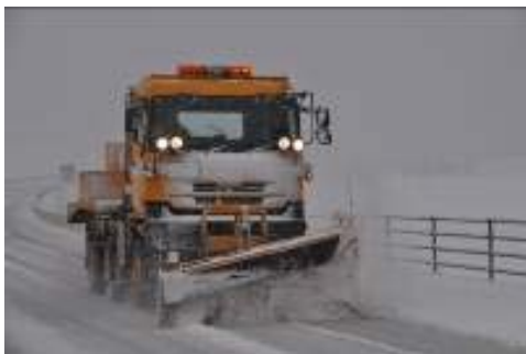
除雪トラック ※雪を取り除く機械