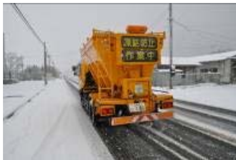
凍結防止剤散布車 ※凍結防止剤を散布する機械