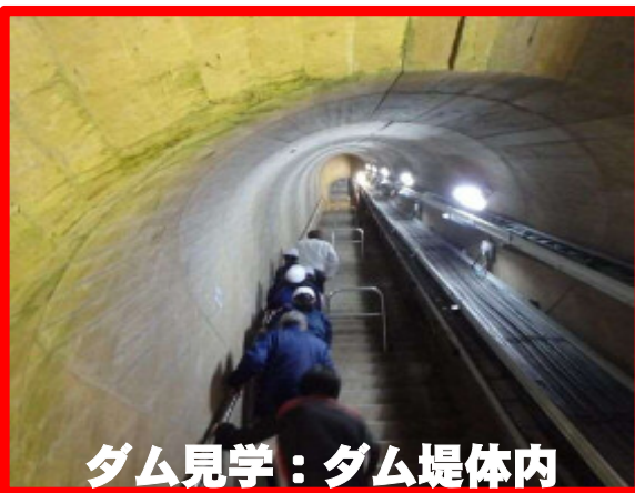
ダム見学：ダム堤体内