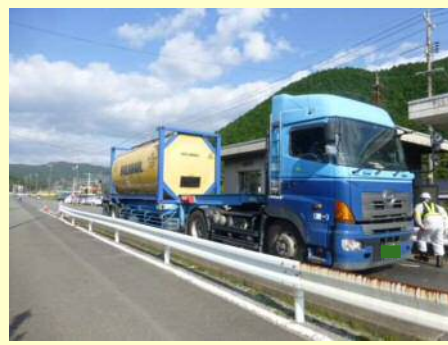
車両番号不一致違反