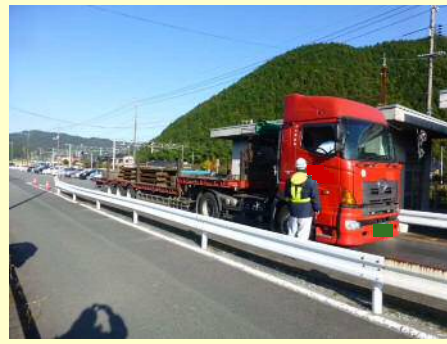
車両総重量不一致違反