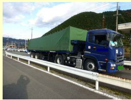
車両寸法不一致違反