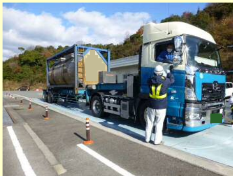
通行条件（誘導車の配置）違反

今回の取締では、 16台 のうち 9台 の違反があり、是正指導等を行いました。 今年度は現在までに、取締を6回実施して、合計 95台 のうち 64台 に是正指導等を行いました。