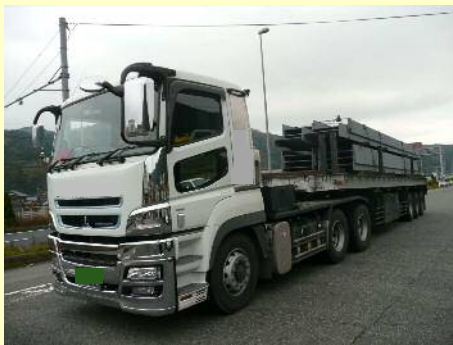
車両総重量不一致違反

今回の取締では、 9台 のうち 4台 の違反があり、是正指導等を行いました。今年度は現在までに、取締を2回実施して、合計 17台 のうち 11台 に是正指導等を行いました。