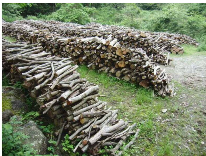
伐採木の現地仮置状況（赤山公園）