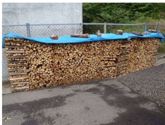
伐採木材利用例（薪）