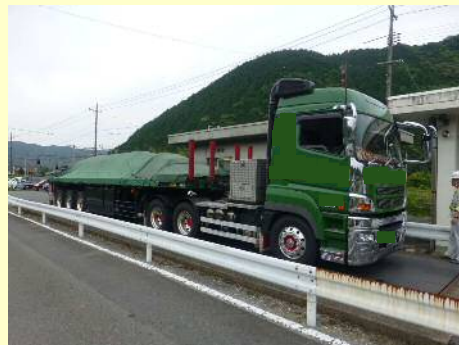
※許可証に示す寸法を超える状態で道路を通行した事例