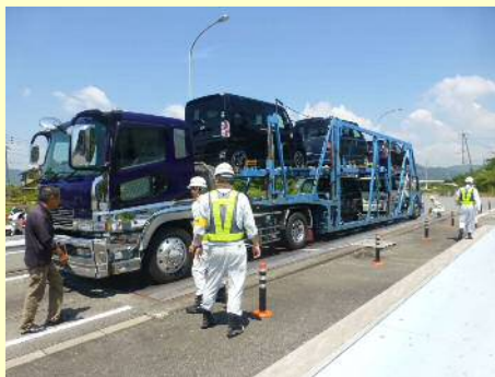
車両寸法不一致違反

今回の取締では、 9台 のうち 6台 の違反があり、是正指導等を行いました。今年度は現在までに、取締を4回実施して、合計 35台 のうち 23台 に是正指導等を行いました。