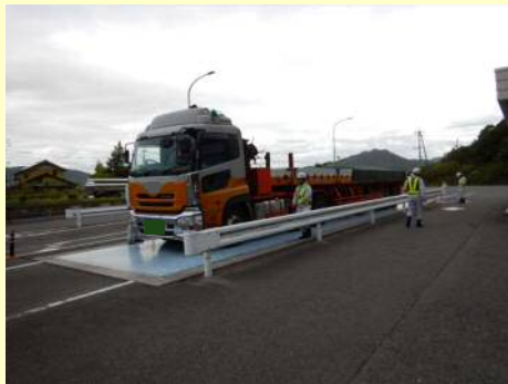
車両寸法不一致違反

今回の取締では、 9台 のうち 5台 の違反があり、是正指導等を行いました。今年度は現在までに、取締を5回実施して、合計 44台 のうち 28台 に是正指導等を行いました。