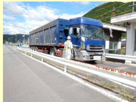
※許可証に示す寸法を超える状態で道路を通行した事例