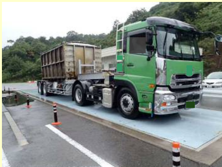
車両重量不一致違反

今回の取締では、 3台 のうち 2台 の違反があり、是正指導等を行いました。今年度は現在までに、取締を6回実施して、合計 47台 のうち 30台 に是正指導等を行いました。