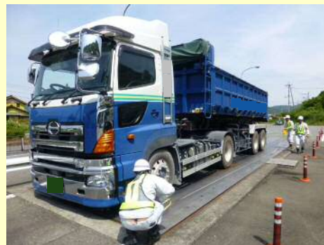
※許可証に示す寸法を超える状態で道路を通行した事例