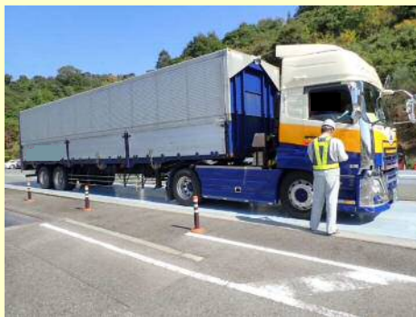
車両総重量一致違反

今回の取締では、 11台 のうち 5台 の違反があり、是正指導等を行いました。 今年度は現在までに、取締を7回実施して、合計 58台 のうち 35台 に是正指導等を行いました。