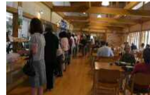
■農家レストラン「つつじ」