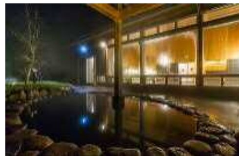
■くすのき温泉「くすくすの湯」