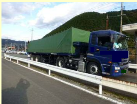
車両寸法不一致違反

今回の取締では、10台のうち5台の違反があり、是正指導等を行いました。 今年度は現在までに、取締を9回実施して、合計77台のうち45台に是正指導等を行いました。