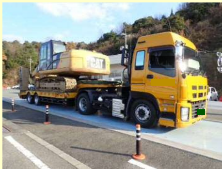
車両総重量不一致違反

今回の取締では、 11台 のうち 8台 の違反があり、是正指導等を行いました。 今年度は現在までに、取締を10回実施して、合計 88台 のうち 53台 に是正指導等を行いました。