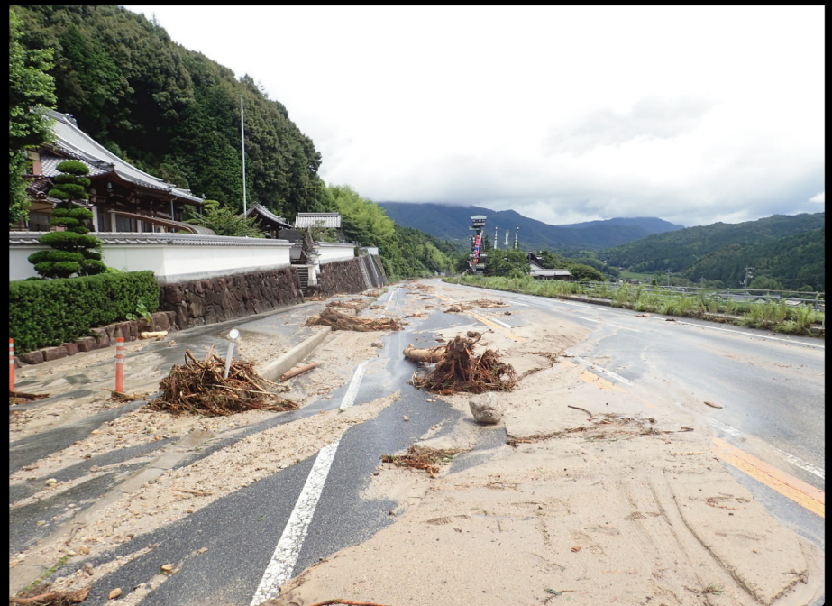
平成30年7月豪雨による被災状況