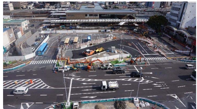
現況写真（令和元年10月28日現在）