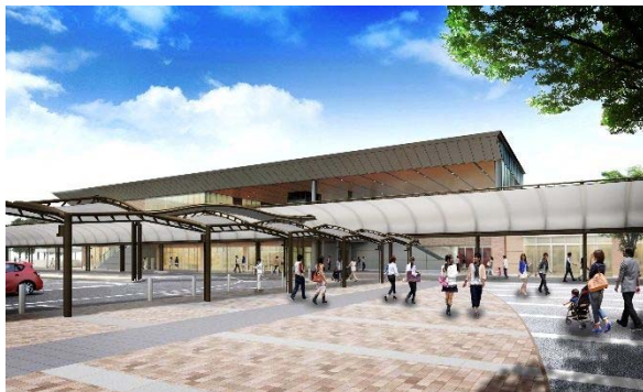
リニューアル後の西口駅前広場イメージ （岩国市資料）