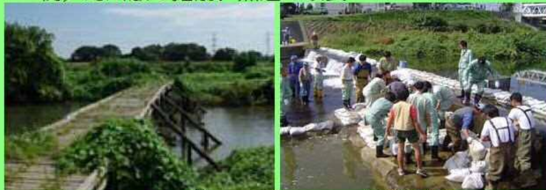
ピオトープの整備