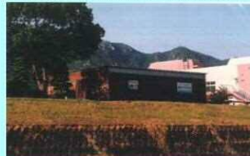
市民団体による活動拠点の整備事例 (佐波川)