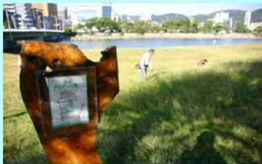
市民団体による看板設置事例 (太田川)