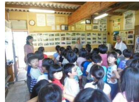
年代別の 河川勉強会

河川管理者と共に河川の安全利用点検を行ったり、河川敷の除草やゴミ拾いなど河川環境美化活動を行っています。