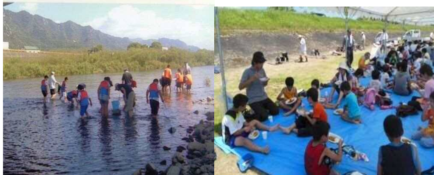
令和元年7月28日 防府市で河川愛護イベントを実施しました。参加者90人