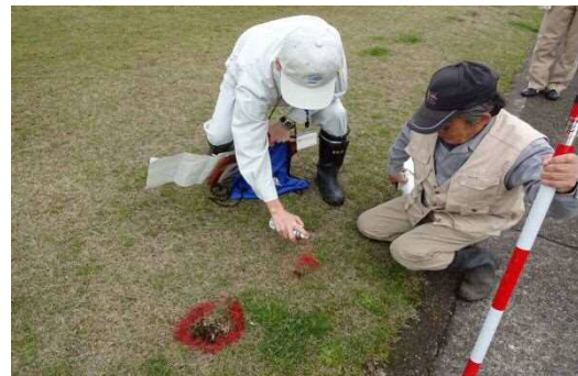
平成31年4月19日 安全利用点検