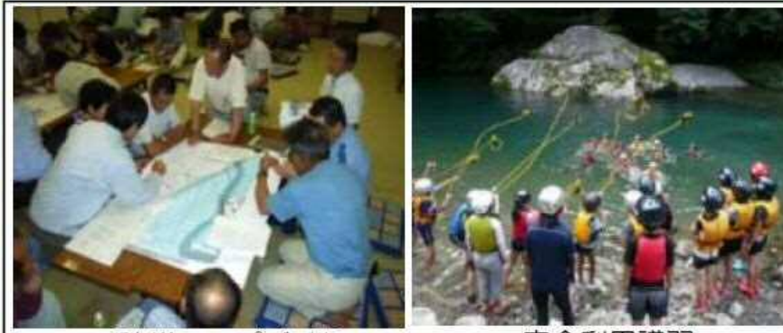
マイ防災マップづくり