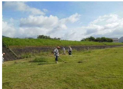
除草などの河川美化活動