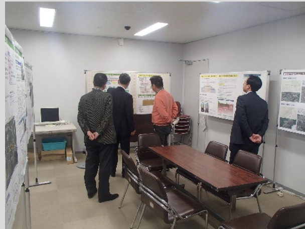
オープンハウス開催イメージ (R2.1.18岩国市役所特別会議室にて)