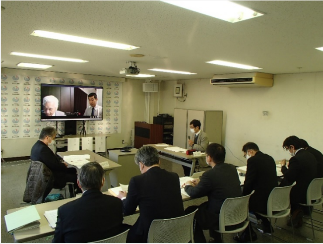
第1回 委員会開催状況 (山口河川国道事務所 第1会議室にて)

令和3年2月3日に一般国道2号岩国・大竹道路の山手トンネル（仮称）に係る、トンネル構造及びトンネル建設に伴う地表面沈下等の周辺影響について、公正・中立な立場で客観的データに基づき、科学的な審議・検討を行うことを目的として、「一般国道2号岩国・大竹道路トンネル技術検討委員会」（以下、委員会）を開催しました。