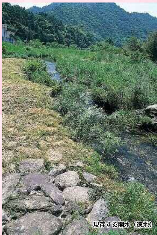
現存する関水（徳地）

また、上人は作業員の心身のリフレッシュのために石風呂を設けるほか、建築物では周防阿弥陀寺の建立や徳地にある月輪寺（県内最古の木造建築）の建立も行うなど、佐波川流域の経済、福利厚生、仏教信仰などの分野に大きな功績を残しました。