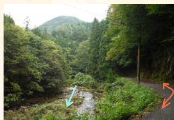
木材運搬の昔(左の佐波川)と今(林道)奥は滑山国有林