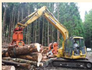
スイングヤーダ(旋回ブーム式タワー付集材機)による伐採木の収集運搬